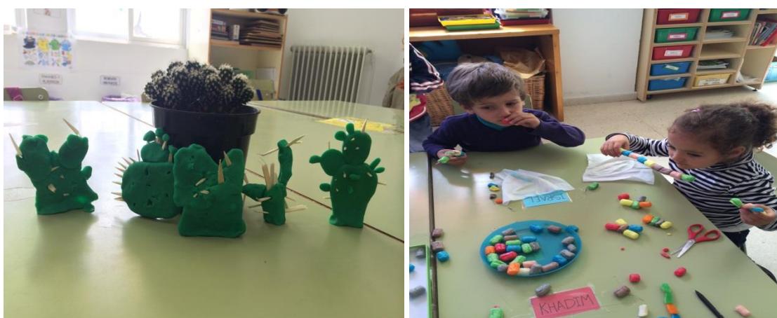
Fotografía 11: Haciendo plantas de plastilina y play mais.

En este proyecto no sólo hemos realizado estas actividades, sino que se han ido creando rincones provisionales como el de las palabras, que a medida que los niños y las niñas iban adquiriendo más conocimientos sobre las plantas, mostraban más inquietudes de aprendizaje y afán por experimentar y descubrir, creando juegos de palabras, flores numéricas, investigando en cuentos ayudándose y aprendiendo los unos de los otros.