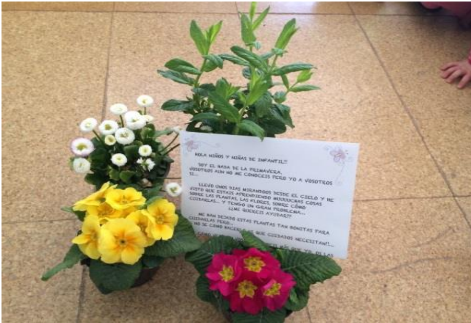
Fotografía 3: Carta del Hada Primavera.

Enseguida los niños mostraron su entusiasmo ante la misión que les había encomendado el hada y plantearon que habría que hacer con ellas.