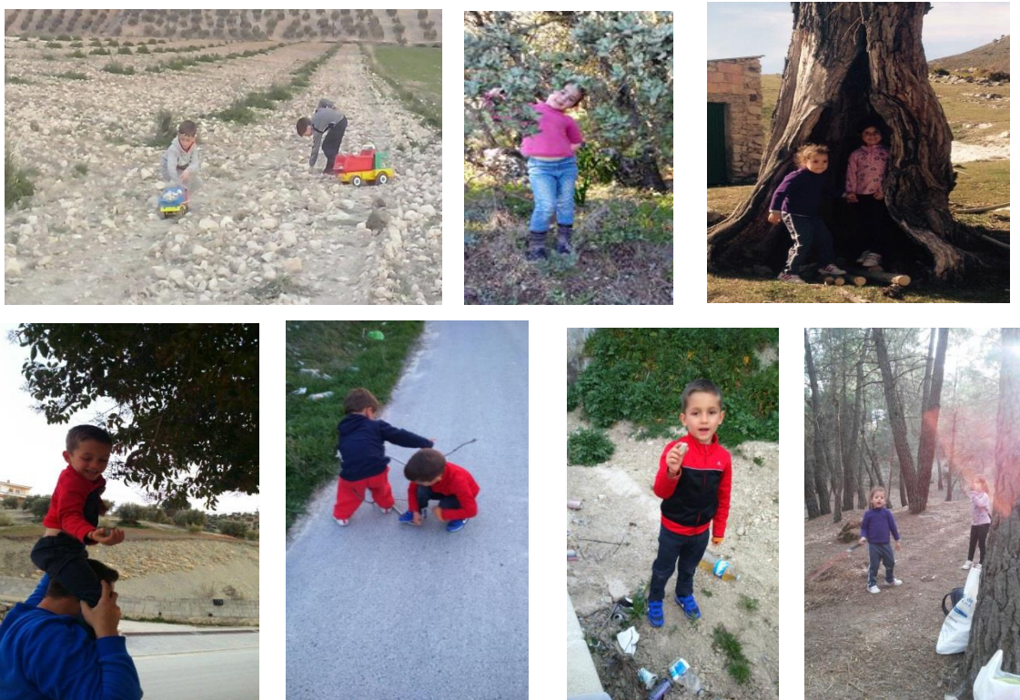
Fotografía 1: Los niños y niñas de 3 y 4 años buscando elementos del entorno para nuestro proyecto. 1