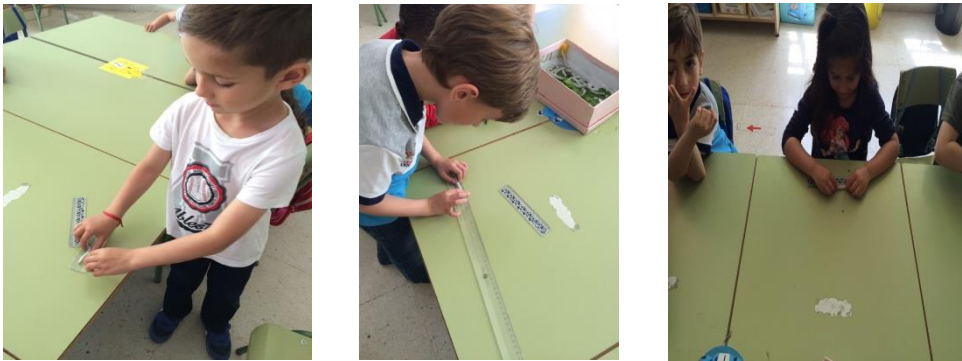
Fotografía 8: Midiendo gusanos.

Esta actividad tuvo alguna consecuencia al no contralar las fuerzas al cogerlos.