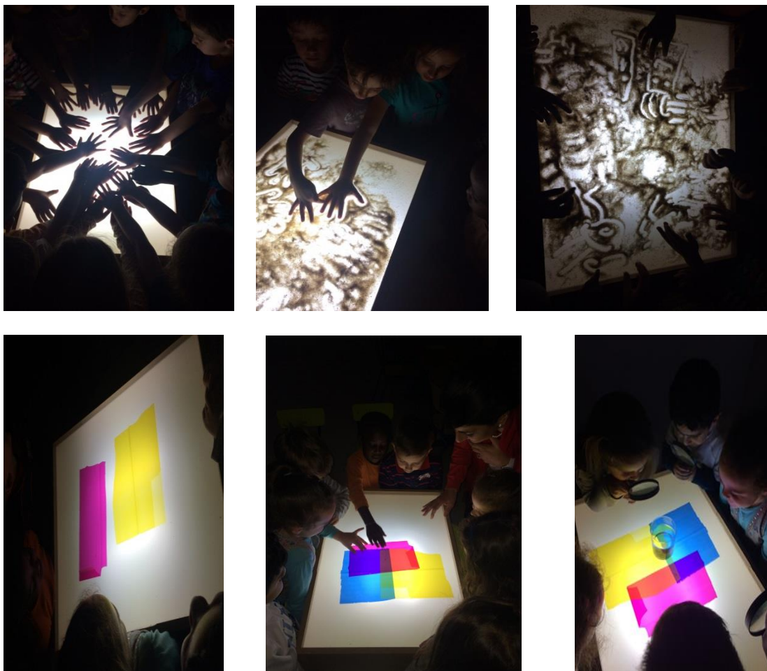
Fotografía 15: Los niños descubriendo la luz.

Para iniciar este proyecto, me dispuse a crear una mesa de luz, con el fin de que descubriesen las posibilidades que pueden tener al investigar en ella.