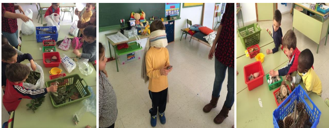
Fotografía 2. Clasificamos y trabajamos la comparación.

Tras tener todos los elementos clasificados, jugamos a comparar con los ojos cerrados el tamaño, textura y peso de los objetos que teníamos entre nuestras manos. Se divertieron mucho e incluso ellos hacían que invirtiésemos los papeles de seños y alumnos, tapándonos a nosotras los ojos y teniendo que descubrir de qué se trataba el objeto que teníamos entre nuestras manos.