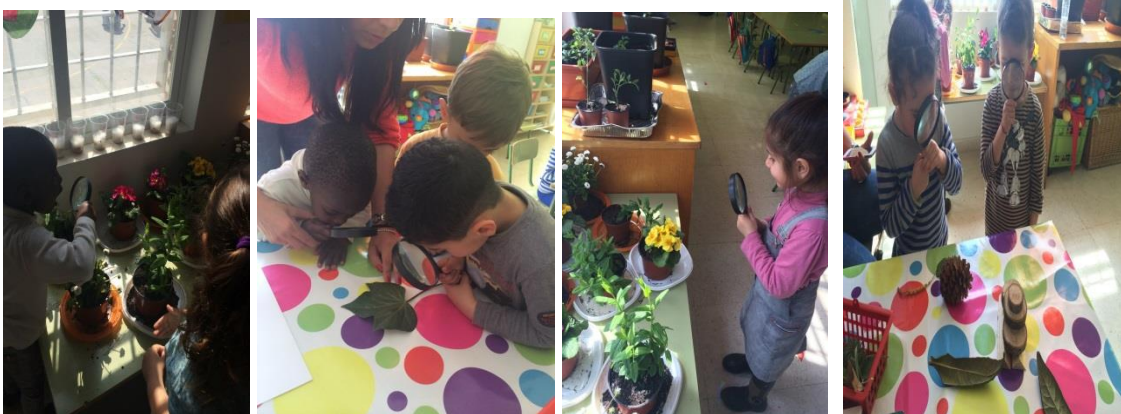
Fotografía 4: Niños observando con las lupas el rincón de la naturaleza.

Enseguida los niños mostraron su entusiasmo ante la misión que les había encomendado el hada y plantearon que habría que hacer con ellas.