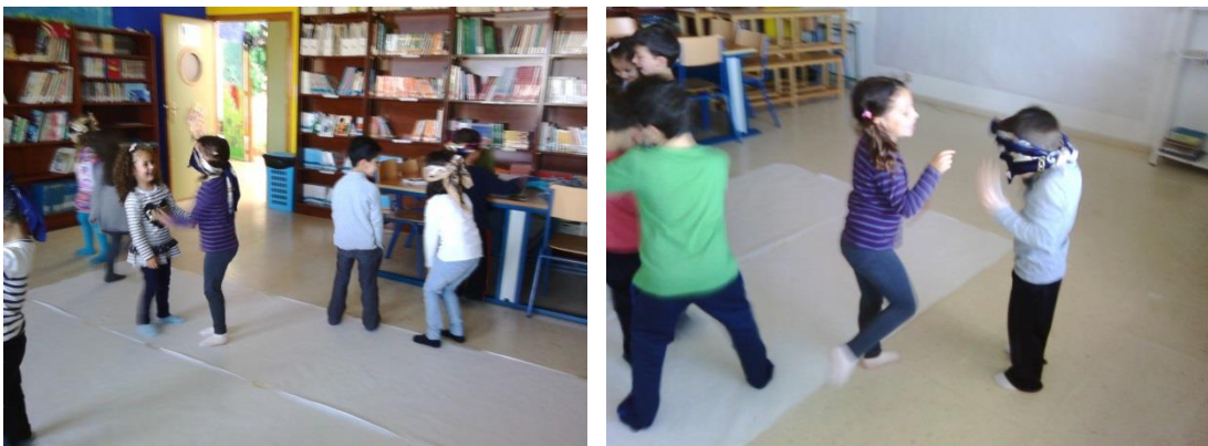
Fotografía 13: Las gallinitas ciegas.