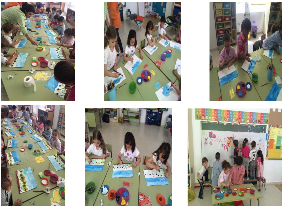
Fotografía 9: Pintando girasoles.