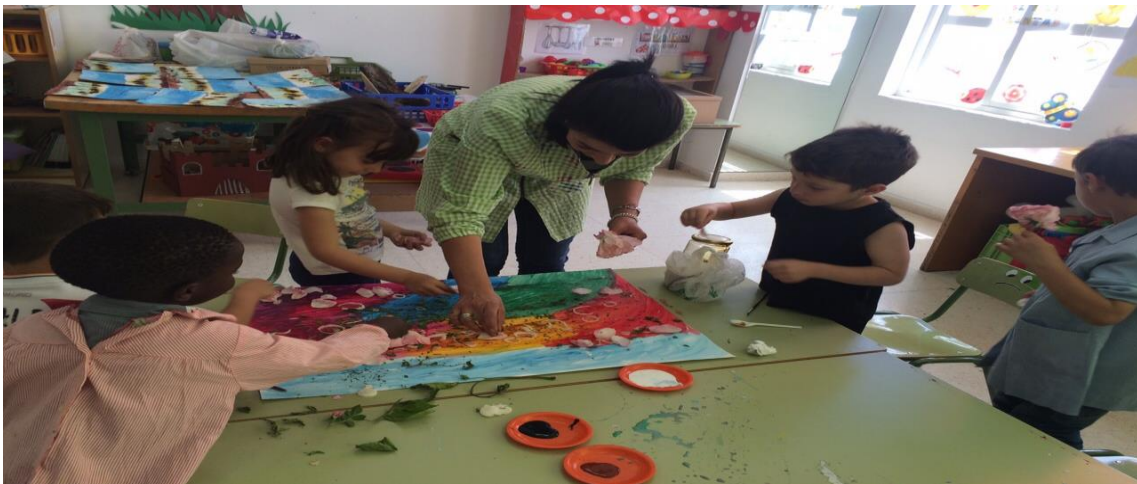
Fotografía 10: Construyendo un arcoíris especial.

Con la pintura que nos había sobrado junto con otros colores, comenzamos a pintar, pero pensaron que podían decorar la obra, así que los niños y niñas empezaron a poner elementos a la pintura como aros de cebolla, flores, café, azúcar e incluso le pusimos miel.