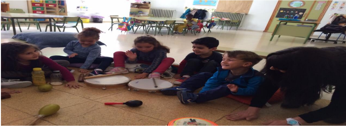
Fotografía 12: Haciendo música.

En todo momento la música ha estado presente en las tres sesiones, ofreciéndoles diferentes estilos y ritmos musicales.