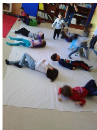
Fotografía 14: Los niños haciendo la croqueta mientras pintan.