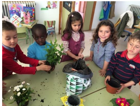
Fotografía 5: Los niños de 3, 4 y 5 años trasplantando las plantas del Hada Primavera.